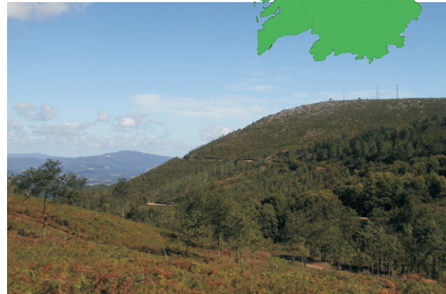
Vista do Castrove desde A Escusa. Ao fondo o Xabre.

A volta pódese facer polo camiño de ida ou combinar un co outro. Ao pé do depósito hai un camiño que baixa, con bastante pendente, que nos acorta un pouco o traxecto.