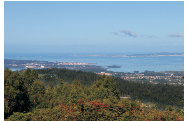
A Toxa e O Grove desde a ruta.