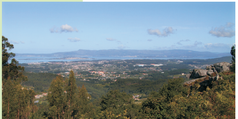
Vista sobre o Salnés e a ría de Arousa