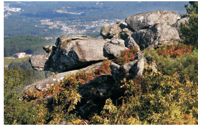
Curiosa formación rochosa